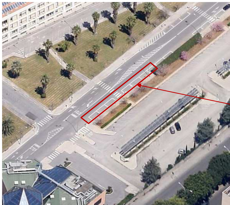
Parceggio Polididattico Area di occupazione del suolo stradale